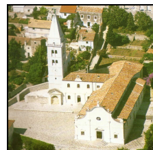
Župa Rođenja B.D.Marije